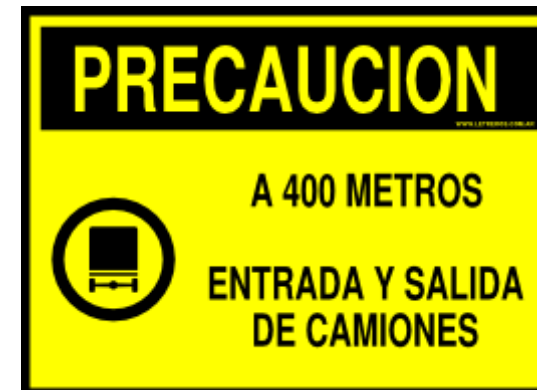
Figura 2: Modelo de cartel advertencia de camiones"