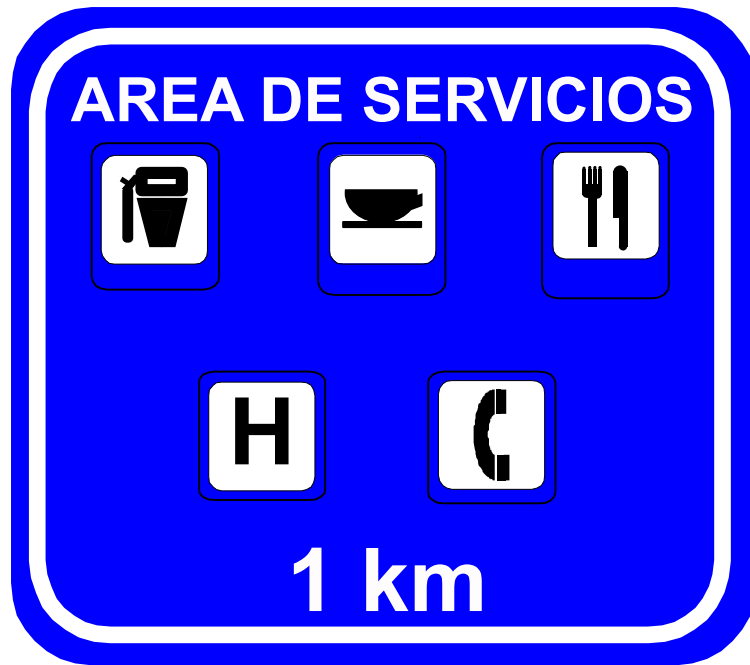
Figura 1: Modelo de Señal "Área de Servicios xx km."